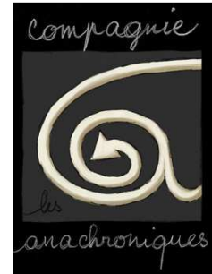
Compagnie les anachroniques

Cette conférence spectacle se déroulera en trois actes :